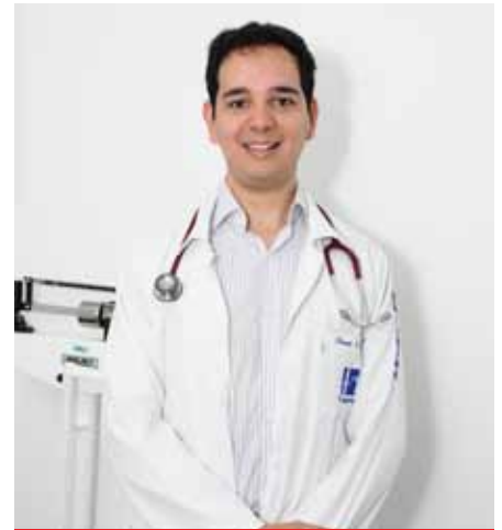
O GERIATRA RENATO DELGADO GALIBERT

Pouco se avançou até o momento em relação a medicamentos que possam prevenir ou tratar o problema. Por esse motivo, as medidas mais efetivas são atividade física regular e ingestão nutricional adequada. Ambas as terapias, física e nutricional, devem ser orientadas pelo médico geriatra em conjunto com equipe de nutricionista e fisioterapeuta ou educador físico. “Por não haver