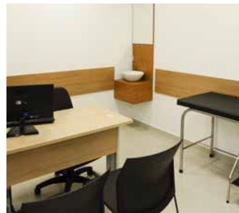
30 CONSULTÓRIOS NO TOTAL

te que está em um Centro Médico da Santa Helena em qualquer cidade do Grande ABC.