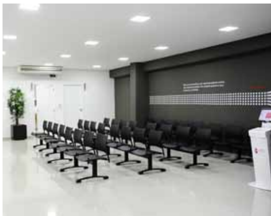
AMBIENTE DE ESPERA SEGUE PADRÃO DA REDE

O novo Centro Médico tem espaços mais bem aproveitados e uma logística que permite melhorar o atendimento e o deslocamento dos beneficiários pelo local. O projeto também segue a padronização de comunicação externa e interna da rede, que prevê a mesma identidade visual para todos os centros médicos, inclusive no mobiliário, nas cores, no piso e na decoração, entre outros detalhes. Com isso, o beneficiário identifica imediatamente